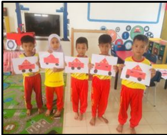
kanak-kanak mempamerkan hasil kerja